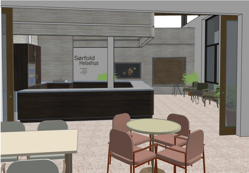
3D usnitt som viser kafe fondvegg med peis

NB! Løsning må detaljere ytterligere i samråd med brukene for å forsikre om at alle rom får best egnet innredning i forhold til bruk. Produsent/ Leverandør står ansvarlig for konstruksjon og stabilitet samt å ta kontrollmål på stedet. Tegningen viser hovedutførelse og prinsipppløssninger. Produsent/Lev. kvalitetssikrer og foreslår eventuell endringer. Produksjonstegninger skal utarbeides av produsent og godkjennes av IARK/ARK. Overflater og materialer sjekkes iht.siste oppdaterte brannrapport fra RIBr.