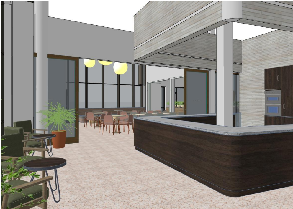
3D usnitt som viser kafe motorstue

Møbleringen er variert, med noen plassbygde elementer gir en ryddig og oversiktlig gangsgang. Og annen løs møblering som oppbevaring, stoler og bord gir muligheten til å møblere rommet etter bruk. Møbleringen må være tilpasset brukere i alle aldre, med like stort fokus på barn som på eldre. Dette skal vi kommunens nye samlingssted.